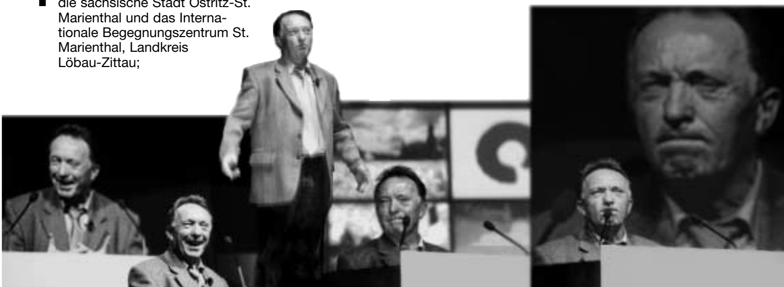
Tatort-Kommissar Ehrlicher alias Peter Sodann hatte sichtlich nicht nur selbst viel Spaß bei der Enttarnung der „TAT-Orte“, auch das Publikum genoss seine professionelle und schauspielerisch gekonnte Moderation und verdeutlichte dies mit viel Applaus.