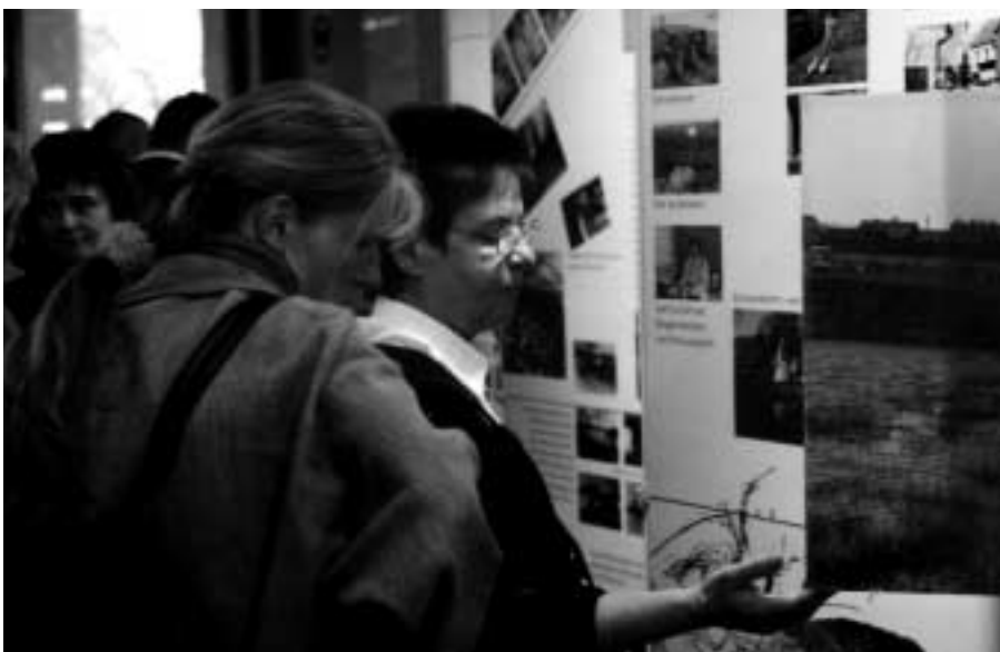
Großes Interesse fand auch die „TAT-Orte“-Ausstellung, die nicht nur die acht Preisträger des Jahres 2000 zeigte, sondern alle 24 Preisträger des Gesamtwettbewerbs.

Ein wichtiger Bestandteil der Entwicklung ist die Arbeit des Internationalen Begegnungszentrums St. Marienthal. Dieses Zentrum greift die Verpflichtung der „Energieökologischen Modellstadt“ auf, das vorhandene Wissen und die Erfahrungen