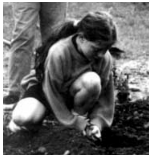
Aus: „Nicht ohne uns! Ein Spielplatz von und mit Kindern“, Stadt Karlsruhe

Grundsätzliche Fragen haben die Kölner Erfahrungen mit Kinder- und Jugendforen aufgeworfen. Diese offenen Formen der Mitwirkung an den Planungs- und Entwicklungsprozessen im Stadtteil, die eine „Beteiligung nach dem Lustprinzip“ erlauben, führten zwangsläufig zu sehr schwan-