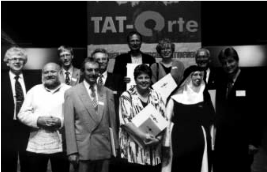
Die „TÄT-er“ 2000.

Projekts „Energieökologische Modellstadt Ostritz-St. Marienthal“ konnte eine autarke Energieversorgung auf der Grundlage regenerativer Energieträger aufgebaut werden. Dabei kommen ein Biomasse-Heizkraftwerk, Windkraftträder, solarthermische Anlagen, eine Photovoltaikanlage sowie Wasserkraftwerke zum Einsatz. Weitere Projektaktivitäten der Stadt werden entsprechend dem Ziel einer ökologisch ausgerichteten städtischen Gesamtentwicklung in dieses Konzept integriert, so zum Beispiel Projekte zur Stadt-sanierung, zur umweltgerechten Abwasserentsorgung oder zum ökologischen Waldbau.